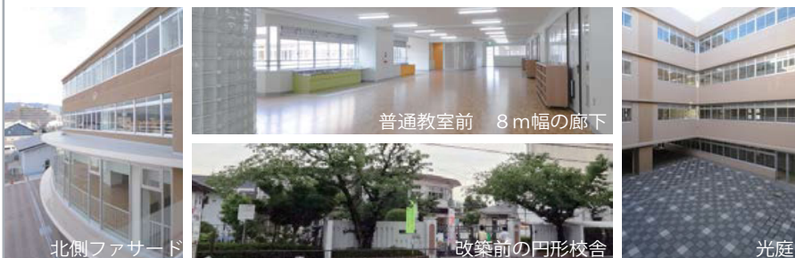
普通教室前 8m幅の廊下