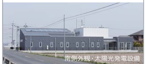
南側外観・太陽光発電設備

消防車両車庫の比較的建物高さが高くなる部分の屋根を利用して、南側に下る勾配屋根を設けます。発電効率を考慮した屋根勾配にすると共に、下地一体型の屋根材により、架台を設置せずとも、合理的に太陽光発電設備の設置が可能な建物形状としています。