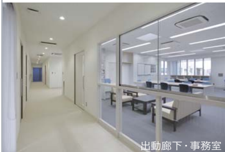
出動廊下・事務室