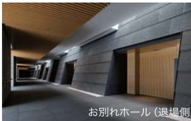
お別れホール（退場側）