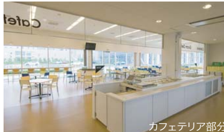
カフェテリア部分