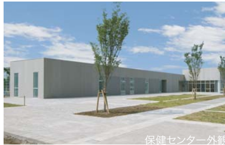
保健センター外観