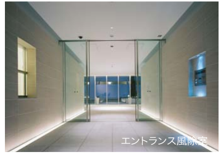
エントランス風際室

又、敷地と道路とのレベル差を利用し、エントランスホール等の共用部分は1.5層分の階高とし、高さのあるホール空間を設けている。