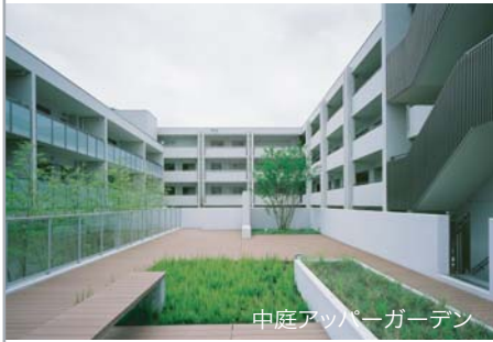
中庭アッパーガーデン