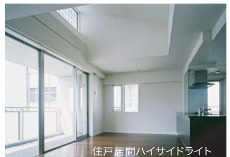
住戸居間ハイサイドライト

敷地面積 : 3,879.57㎡ 建築面積 : 2,327.18㎡ 延床面積 : 8,578.66㎡ 建蔽率 : 59.99% 容積率 : 157.16% 構造・規模 : RC造 地上5階地下1階 住戸数 : 72戸 駐車台数 : 54台 設計期間 : 2004.09~2005.02 工事期間 : 2005.03~2006.03