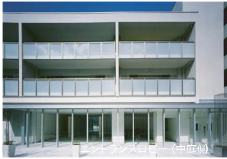
エントランスロビー (中庭側)