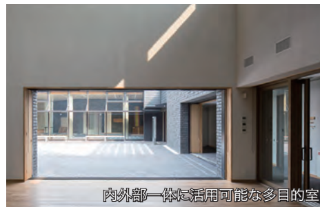
内外部一体に活用可能な多目的室