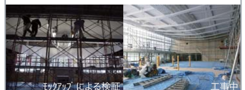
モックアップによる検証