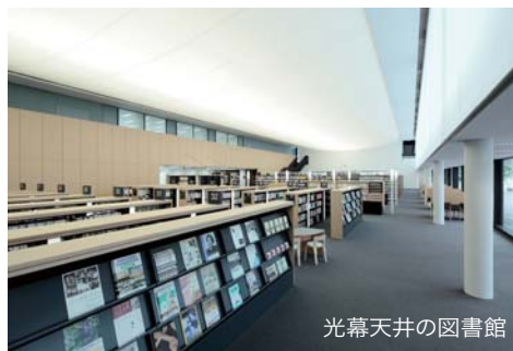
光幕天井の図書館