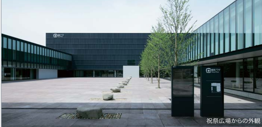
祝祭広場からの外観