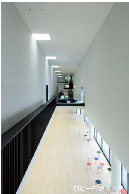
ロビー内観見下ろし