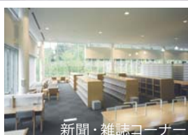
新聞・雑誌コーナー