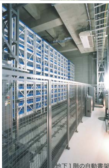
地下1階の自動書架