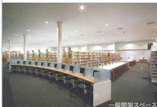
一般開架スペース