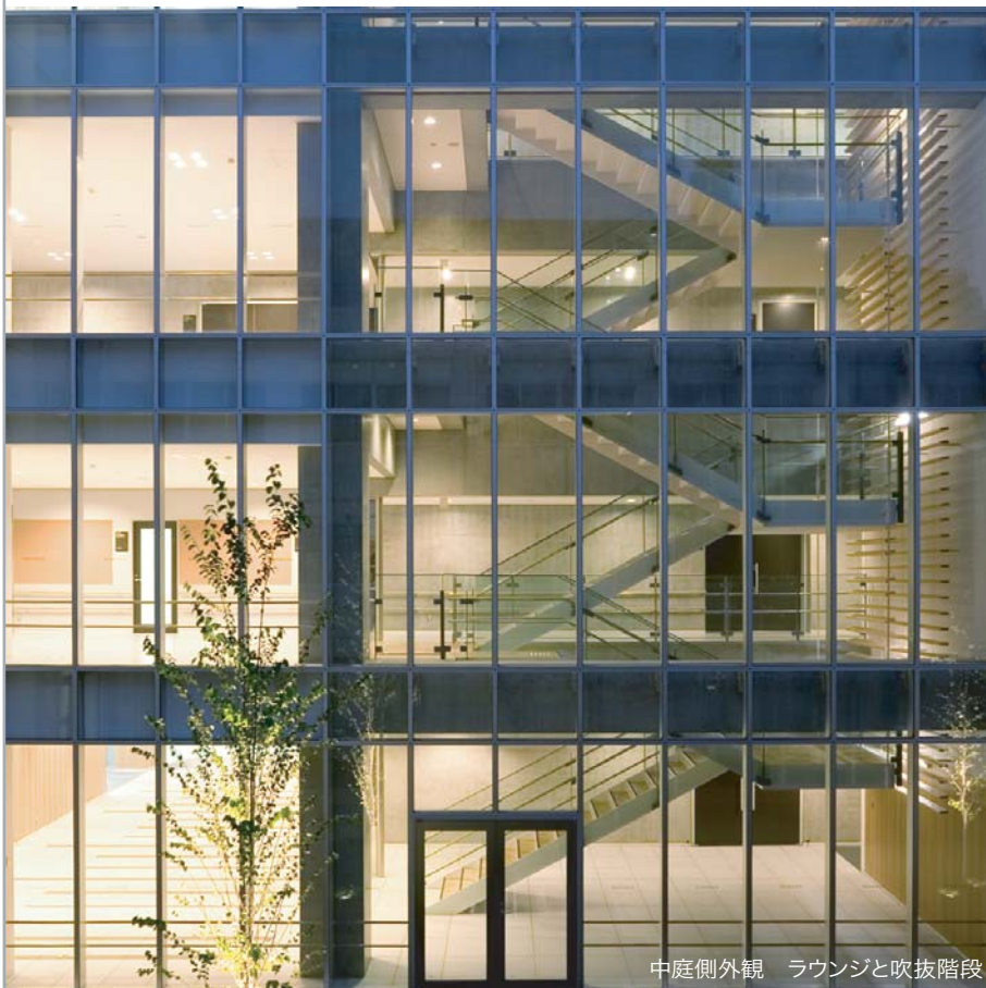
中庭側外観 ラウンジと吹抜階段