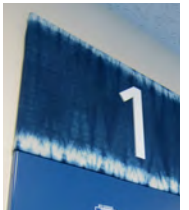
藍染を使用したサイン