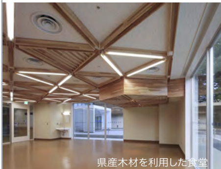
県産木材を利用した食堂