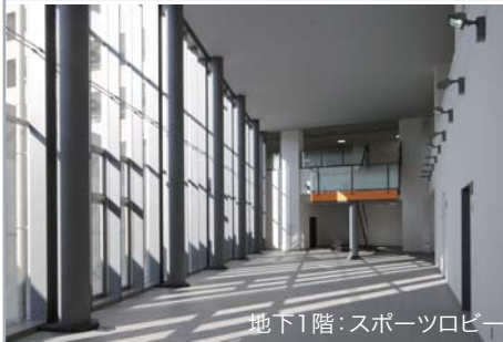
地下1階：スポーツロビー