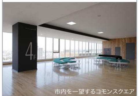
市内を一望するコモンスクエア

単位制高校の特徴である学生の授業時間以外の待機スペースを、建物中心部に設け、学校生活における中心と考えます。内装仕上げとして県産材の杉板張り壁面、桧フローリングにより、やわらかく人に優しい溜まりの空間としております。