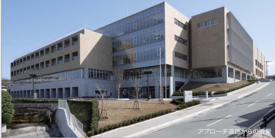
アプローチ道路からの近景