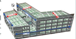
構造架構モデル図

近隣の居住環境や法的な高さ制限に配慮し、幹線道路沿いの第2種住居地域に“く”の字型の主たる立体を積層しました。プレストレストコンクリート(PRC)の架構で6.3m×13mの均一スパンを構成し、外壁全周はプレキャストコンクリートとしています。フレキシブルで耐久性の高い躯体(スケルトン)によって、利用者にとっては分かりやすい業務窓口を提供し、職員にとっては使いやすく管理しやすい専用エリアを区分して設けました。