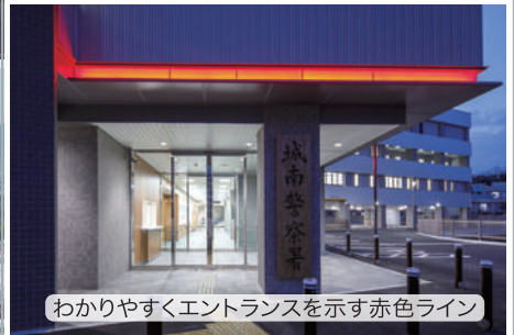
わかりやすくエントランスを示す赤色ライン

道路に面する“く”の字、内側部分をガラスカーテンウォールのファサードとし、各層の庇で水平ラインを強調することで、小さな間口で接道している幹線道路に対して、警察機能の存在感を十分に示し、まちを安全に見守る“行灯”の役割を果たします。