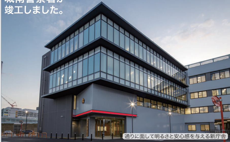
通りに面して明るさと安心感を与える新庁舎