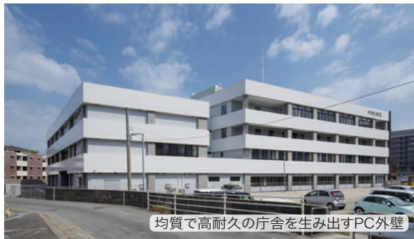
均質で高耐久の庁舎を生み出すPC外壁