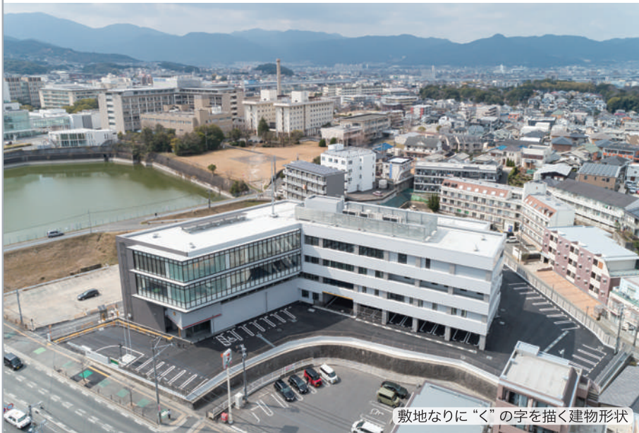
敷地なりに“く”の字を描く建物形状