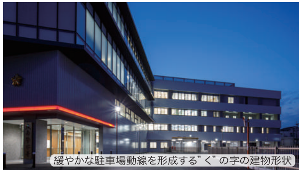
緩やかな駐車場動線を形成する“く”の字の建物形状