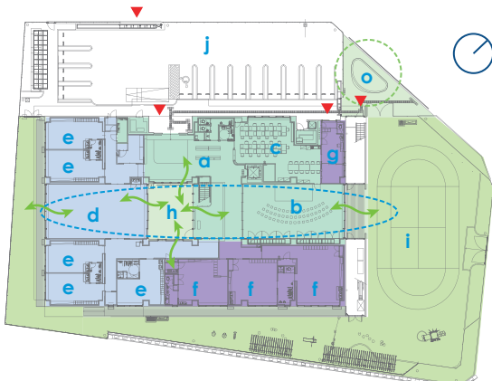
1F PLAN S=1:1000