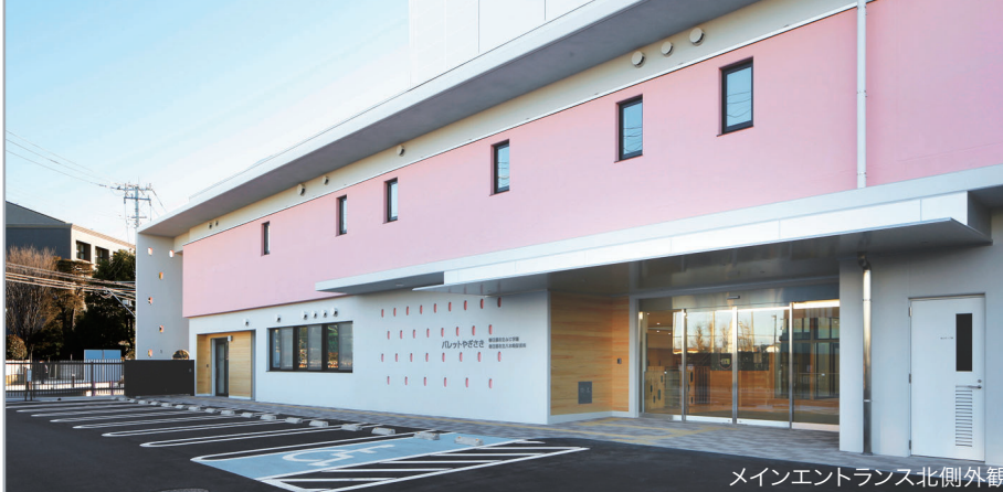
メインエントランス北側外観