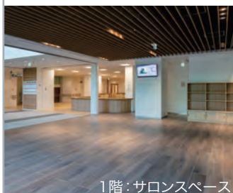
1階：サロンスペース