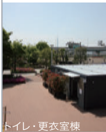
トイレ・更衣室棟