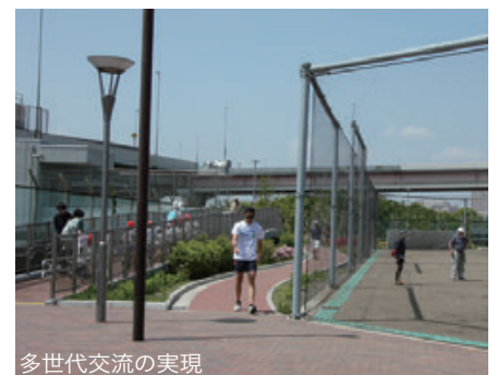
多世代交流の実現