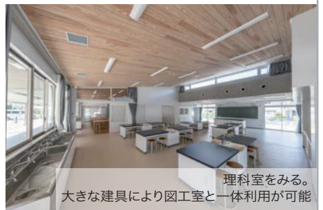
理科室をみる。 大きな建具により図工室と一体利用が可能