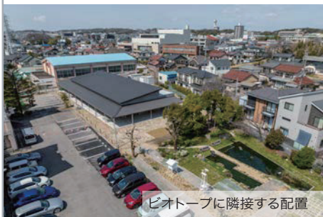
ビオトープに隣接する配置