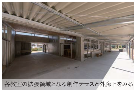
各教室の拡張領域となる創作テラスと外廊下をみる