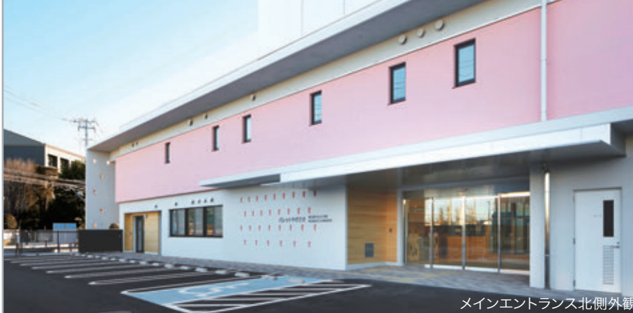
メインエントランス北側外観