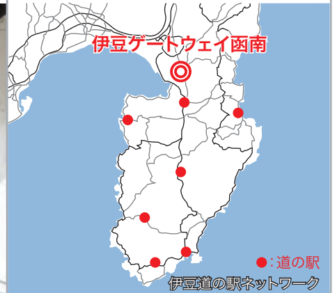
伊豆ゲートウェイ函南

従来の道の駅に求められる諸機能に加え、中庭を中心とした居心地のよい滞在型の施設構成も特徴の一つです。