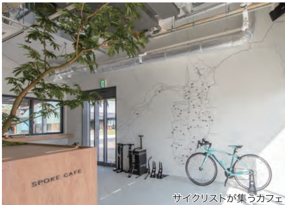
サイクリストが集うカフェ