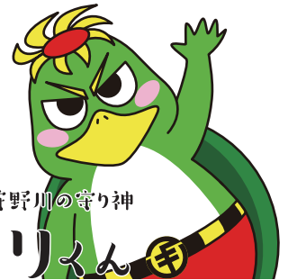
かんをみ 函南の道と狩野川の守り神