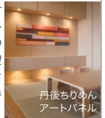
丹後ちりめんアートパネル

京丹後の特産である丹後ちりめんをアートパネルにしました。庭とその先に広がる山々の眺望とともに、京丹後らしさを感じられるような待合室です。