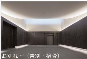
お別れ室（告別・拾骨）