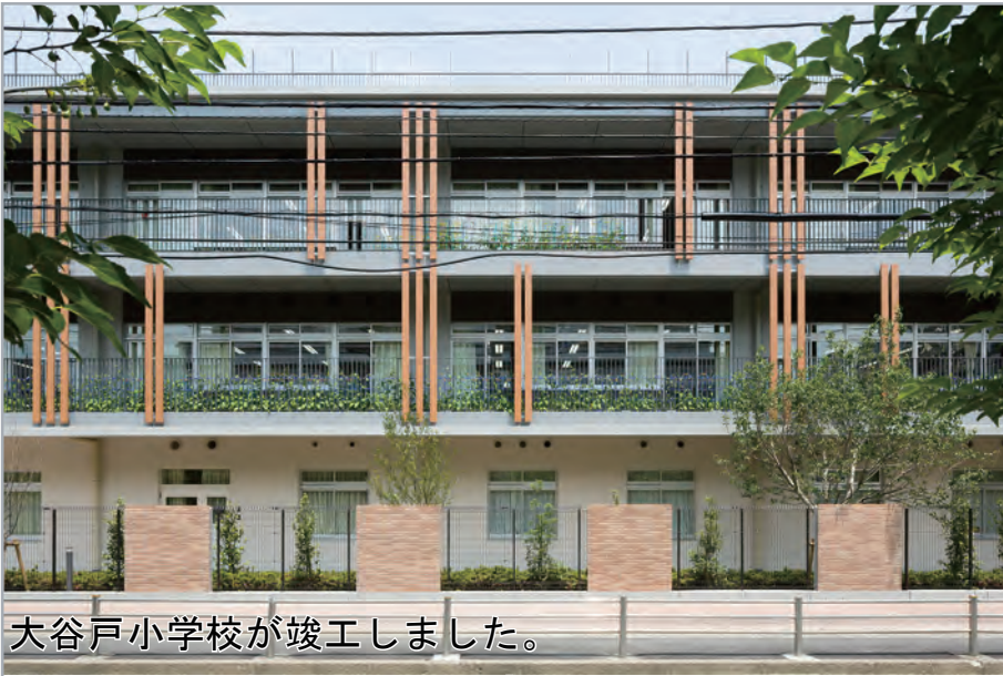
大谷戸小学校が竣工しました。