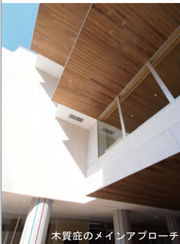
木質底のメインアプローチ