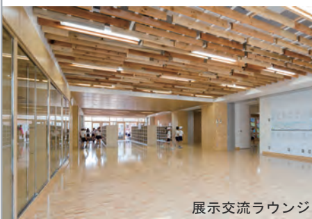
展示交流ラウンジ