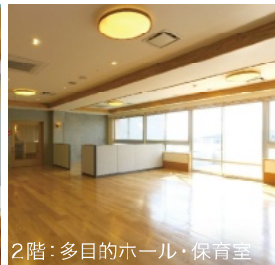
2階：多目的ホール・保育室