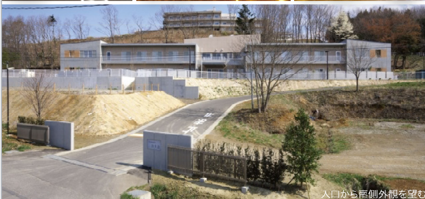
入口から南側外観を望む