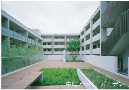
中庭アッパーガーデン