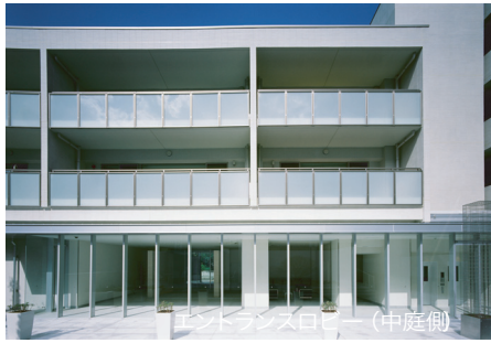
エントランスロビー (中庭側)