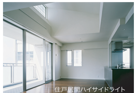
住戸居間ハイサイドライト