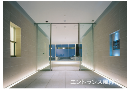
エントランス風際空間

又、敷地と道路とのレベル差を利用し、エントランスホール等の共用部分は1.5層分の階高とし、高さのあるホール空間を設けている。