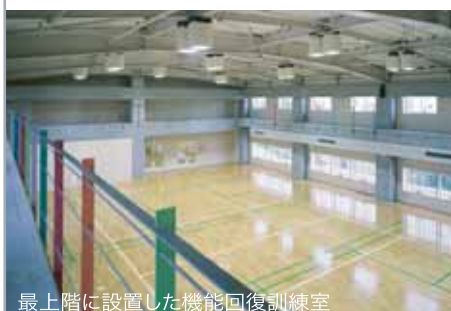
最上階に設置した機能回復訓練室