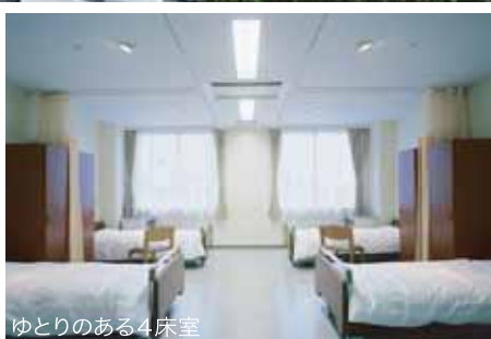
ゆとりのある4床室