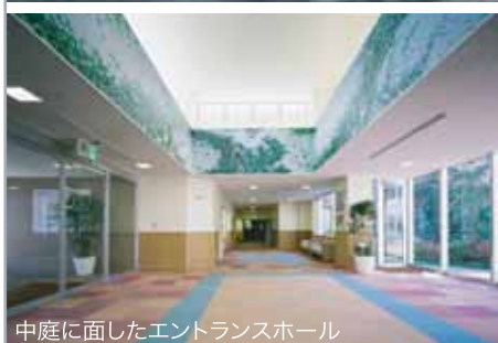
中庭に面したエントランスホール