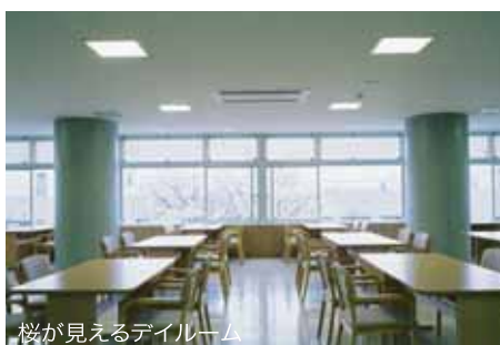
桜が見えるダイニング