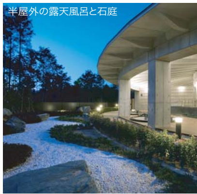
半屋外の露天風呂と石庭