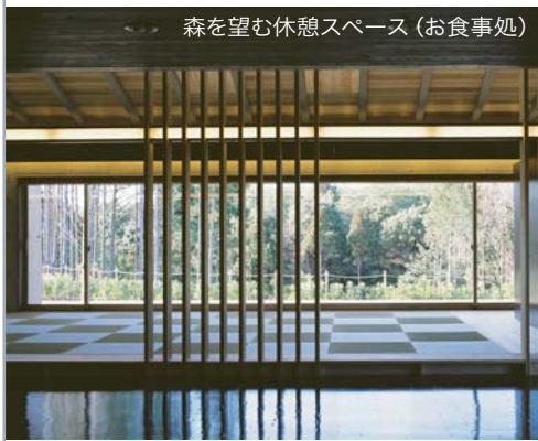
森を望む休憩スペース（お食事処）

建物はコンクリート打放し仕上げを基調に、県産材である杉板や自然素材である竹を天井面や壁面になどに加えることで、モダンでありながら温かみの感じられる空間としています。また、PC（プレキャストプレストレストコンクリート）床板の屋根を採用する事で構造工法上もシンプルな天井屋根面を創り、コストパフォーマンスを考慮した計画としています。大きな樹の下で入浴することをイメージした大断面集成材使用の内湯は、杉板仕上材の裏側に通気層を設けて自然乾燥を誘発する設計とするとともに、ガラス繊維の入った浸透性撥水塗装を施して最善の防腐対策をしています。