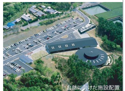
自然に向けた施設配置