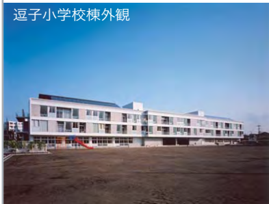
逗子小学校棟外観