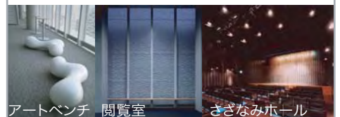
アートベンチ 閲覧室