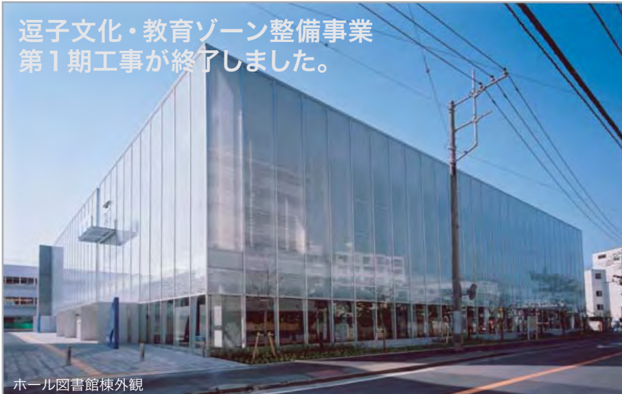
ホール図書館棟外観