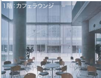
1階：カフェラウンジ