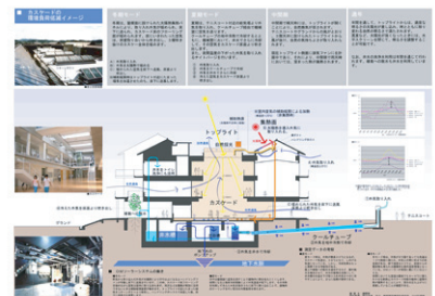
プレゼンテーションボード

＊鏡野町立鏡野中学校が第4回 ecobuild賞(エコビルド賞) 18作品にノミネートされ、9月30日、東京国際展示場にてプレゼンテーションを行いました。