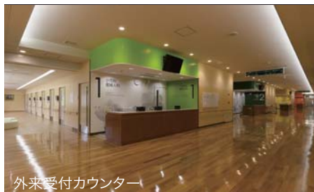
外来受付カウンター