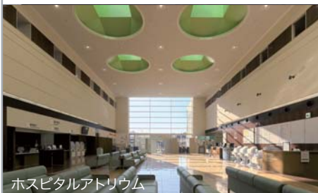
ホスピタルアトリウム