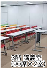
3階 講義室 (90席×2室)